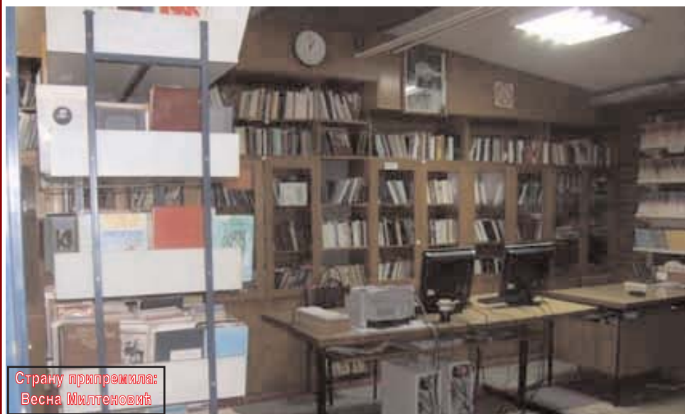
Страну припремила: Весна Милтеновић

Чланарина за позајмљивање књига није повећавана ове године и иста је као лани, износи 200 динара.