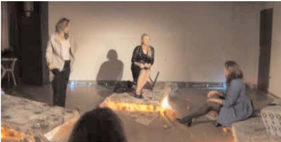
ПРВЕ ВЛАСОТИНАЧКЕ „ФИЛМАЦИЈЕ“